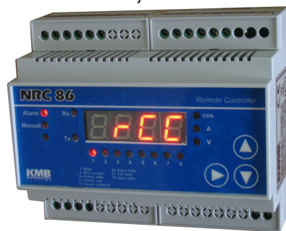
Obr.2 : Řídicí jednotka NRC86

- signalizace nastavení jalového výkonu (odpovídající přijatému